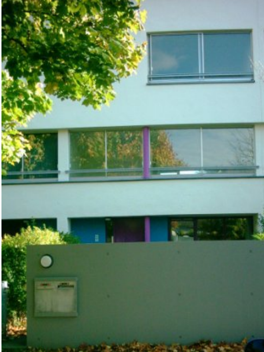
Het huis voor Diaconale Opvang Almere