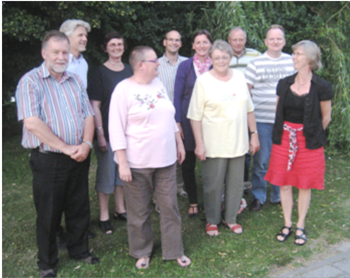
Leden van het College van Diakenen PKN Almere

Het motto van de deelprojecten is dan ook: “ Doen wat nodig is, terugtreden waar het mogelijk is ”. Iedereen kan meedoen; vrijwillig en soms zelfs redelijk vrijblijvend. Om het open karakter te benadrukken heet ons project ook “ Samen voor Almere ”. Iedere Almeerder kan een steentje bijdragen aan de leefomstandigheden van stadgenoten. Van Almeeders, voor Almeeders, door Almeeders dus.