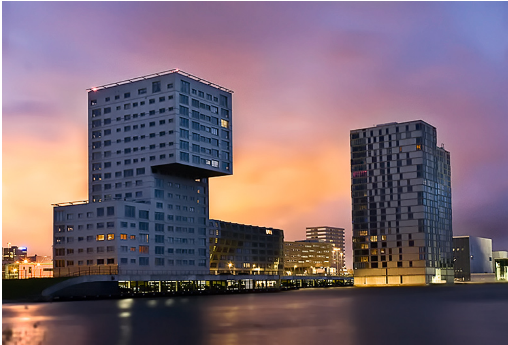
De skyline van het moderne Almere